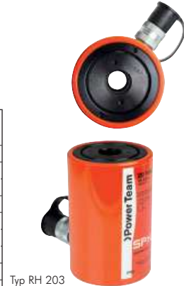
Typ RH 203