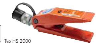
Typ HS 2000