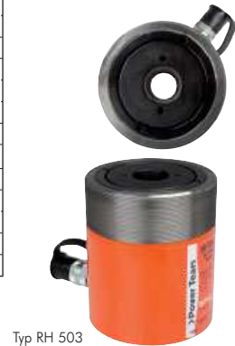
Typ RH 503